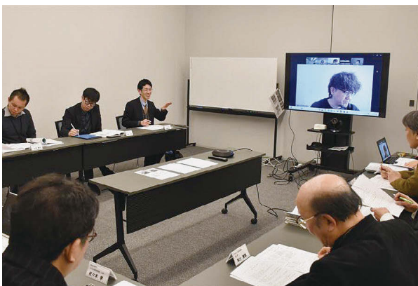
オンラインを含め全道のアドバイザーが参加した研修会

ど「知っている熱中症予防と違う方法が載っていてびっくりしました」。コンクールに応募した後は「おもしろい」と感じる新聞に目を留めるように。高齢者が音楽に触れると、物志れの進行を遅らせる可能性があるという記事を「お年寄りの人たちが役立ててくれたら」と願う。科学関係の記事を読みたいと話す。円山アカデミーは夏休み期間に作文講座を設け「新聞コンクール」への応募作