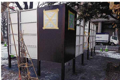
実証実験のために大通公園西5丁目に設置された喫煙所