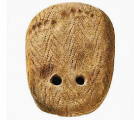
足形付土版（函館市・垣ノ島遺跡＝7400年前、複製）

問7 ② 各地のお墓で、小さな足あとのある粘土板が見つかる。死んだ子の足形をとり、穴を開けて家につるして、親が亡くなるとお墓に入れたのではないかとされているよ。