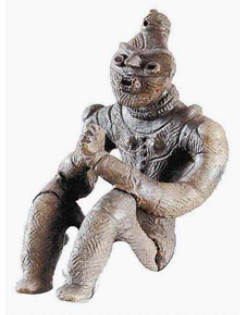
④ 国宝 中空土偶（函館市・善保内野遺跡＝3200年前） ⑥ 国宝 合掌土偶（青森県八戸市・風張1遺跡＝3200年前、複製展示）