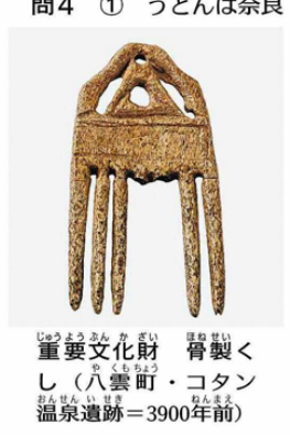
重要文化財 骨製くし（八雲町・コタン温泉遺跡＝3900年前）

行き来した。北海道からはナイフを作るオホーツク地方遠軽町白滝産の黒曜石などを運び、函館では秋田産のアスファルトが見つかる。接着剤として各地へ運ばれたようだ。