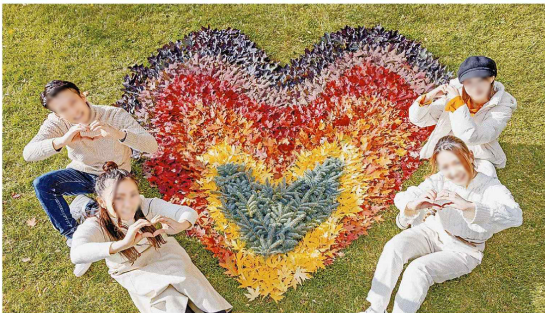
さまざまな色の葉を使って制作したハート形の「葉っぱアート」＝19日

葉っぱアートは同庭園の有料エリア内の芝生広場にある。天候が穏やかだと、3、4日は楽しめるという。