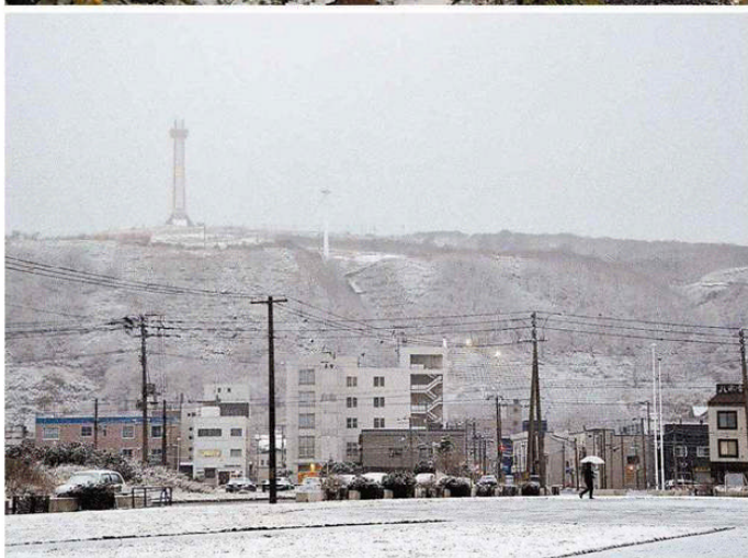
真っ白に雪化粧した稚内公園とその周辺 同日午後4時ごろ

2019年11月8日(金)朝刊 留萌・宗谷版 17ページ (記事は再編集しています)